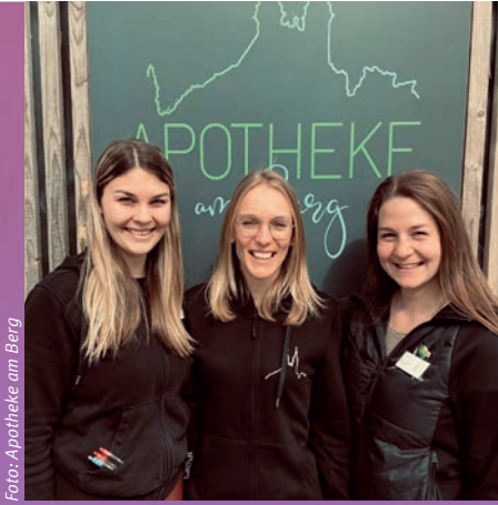
Foto: Apotheke am Berg