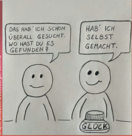
Grafik: Elisabeth Dobesberger-Schmid

Wir beschäftigen uns mit dem Thema Glück. Was macht uns glücklich? Woher wissen wir, dass wir glücklich sind? Müssen wir immer glücklich sein? Könnten wir etwas für unser Glück tun?